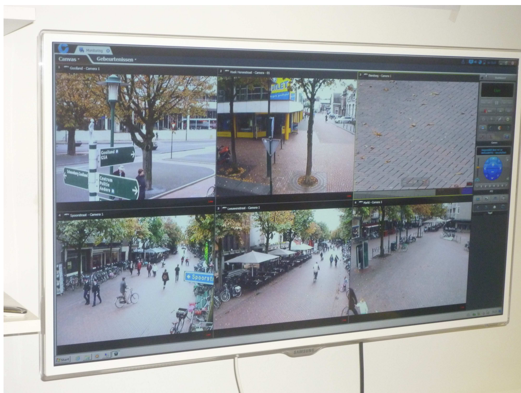
Plasmascherm in cameratoezicht ruimte

Op dit moment is de kamer van de teamchef in het politiebureau op de Groest gedeeltelijk ingericht als cameratoezichtruimte. Dit was bij de start van het cameratoezicht de beste optie, aangezien een aanzienlijke verbouwing in het vooruitzicht was en mede daardoor geen aparte cameratoezichtruimte beschikbaar was. Gezien de tijdstippen van live uitkijken was deze multifunctionele toepassing van deze ruimte mogelijk. In deze ruimte is het op de foto afgebeelde plasmascherm geïnstalleerd. De dienstdoende observant kan hier in alle rust zijn observatie werkzaamheden verrichten.